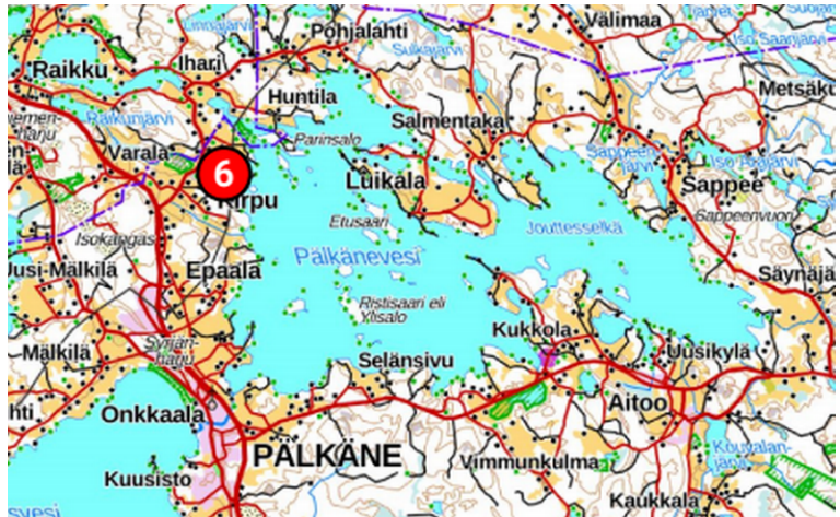
Korteoja sijaitsee Pälkäneveden itärannalla.

Oja kerää vettä laajalta valuma-alueelta, joka alkaa Pihkonsuolta Raikunjärven eteläpuolelta. Oja kulkee pääosin peltoaukean viljelymailla.